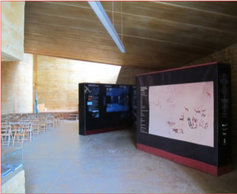
Figura 2. Vista interior del centre.

Per poder desenvolupar el programa educatiu, es feia necessari conèixer no només el propi Conjunt i la seva interpretació (primera part de l'article), sinó també la filosofia educativa de l'Agència (segona part de l'article). El resultat d'aquesta feina col·laborativa va ser un programa de cinc activitats (una per educació infantil, dues per educació primària i dues per educació secundària) que situen l'art rupestre com a eix a partir del qual treballar les diverses competències curriculars i fomentar el desenvolupament personal de l'alumnat (tercera part de l'article).