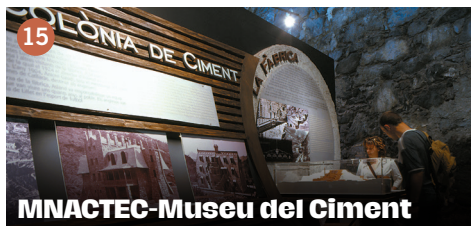
15 MNACTEC-Museu del Cement Paratge del Clot del Moro, s/n 08696 Castellar de n'Hug ☎ 938 257 037 - ♿

Una singular fàbrica de ciment. Una singular fábrica de cemento. A unique cement factory. Une usine de ciment singulière.