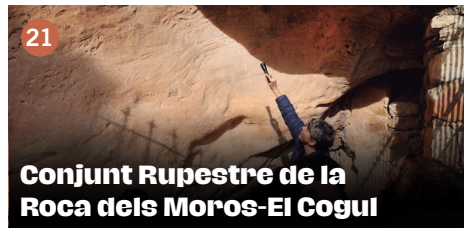
21 Conjunt Rupestre de la Roca dels Moros-EI Cogul Camí del Cogul a l'Albagés, km 1 25331 El Cogul ☎ 672 445 990 - P ♿

Un dels claustres més grans d'Europa. Uno de los claustros más grandes de Europa. One of the biggest cloisters in Europe. Un des plus grands cloîtres d'Europe.