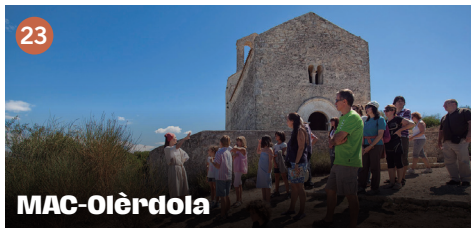
23 MAC-Olèrdola Castell d'Olèrdola, s/n 08734 Sant Miquel d'Olèrdola ☎ 938 901 420 - P ♿

Imponent castell de frontera a l'Anoia. Imponente castillo de frontera en L'Anoia. Imposing border castle in Anoia. Imposant châteaux frontalier dans l'Anoia.