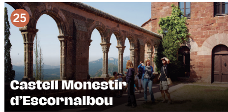
25 Castell Monestir d'Escornalbou Carretera d'Escornalbou, s/n 43771 Riudecanyes ☎ 977 834 007 - P ♿

Espai sagrat únic de l'art rupestre. Espacio sagrado único del arte rupestre. A unique sacred place of cave painting. Espace sacré unique de l'art rupestre.