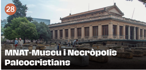
28 MNAT-Museu i Necròpolis Paleocristians Avinguda de Ramón y Cajal, 84 43005 Tarragona ☎ 977 211 175 - ♿

L'autèntic cor del Priorat històric. El auténtico corazón del Priorat histórico. The true heart of the historic Priorat. Le véritable cœur du Priorat historique.