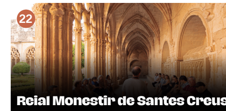
22 Reial Monestir de Santes Creus Plaça Jaume el Just, s/n 43815 Aiguamúrcia ☎ 977 638 329 - P ♿

Un claustre renaixentista a l'Urgell. Un claustro renacentista en el Urgell. A Renaissance cloister in Urgell. Un cloître renaissant dans l'Urgell.