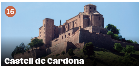
16 Castell de Cardona 08261 Cardona ☎ 938 684 169 - P ♿

Conjunt residencial aristocràtic destinat al lleure. Conjunto residencial aristocrático dedicado al ocio. Aristocratic residential leisure complex. Ensemble résidentiel aristocratique destiné aux loisirs.