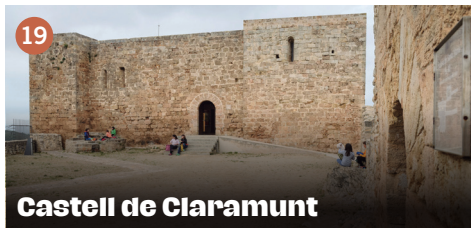
19 Castell de Claramunt Camí del Castell 08787 La Pobla de Claramunt ☎ 938 297 769 - ♿

Una singular fàbrica de ciment. Una singular fábrica de cemento. A unique cement factory. Une usine de ciment singulière.