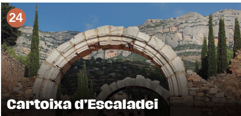
24 Cartoixa d'Escaladei Camí de la Cartoixa, s/n 43379 Escaladei - La Morera de Montsant ☎ 977 827 006 - P

La turbina més gran de Catalunya. La turbina más grande de Cataluña. Catalonia's biggest turbine. La plus grande turbine de Catalogne.