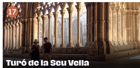
17 Turó de la Seu Vella Turó de la Seu Vella s/n 25002 Lleida ☎ 973 230 653 - P ♿

Un dels cementiris tardoromans millor coneguts. Uno de los cementerios tardorromanos mejor conocidos. One of the best known late Roman Empire cemeteries. Un des cimetières tardo-romains les mieux connus.