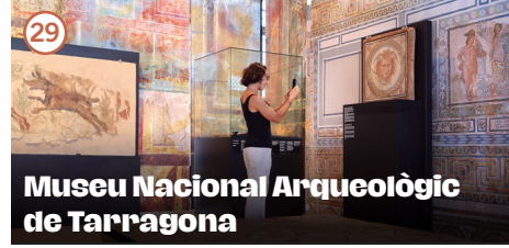
29 Museu Nacional Arqueològic de Tarragona Tinglado 4. Moll de la Costa 43004 Tarragona ☎ 977 236 209 - ♿

Un castell mirador de la Mediterrània. Un castillo mirador del Mediterráneo. A castle overlooking the Mediterranean. Un château mirador de la Méditerranée.