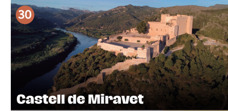
30 Castell de Miravet Camí del Castell, s/n 43747 Miravet ☎ 977 407 368 - P

Art en forma de mosaic. Arte en forma de mosaico. Art in mosaic form. Art en forme de mosaïque.