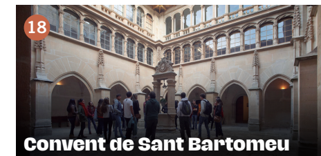
18 Convent de Sant Bartomeu Carretera de Belianes, s/n 25250 Bellpuig ☎ 973 320 292 - ♿

Un viatge a la cultura romana. Un viaje a la cultura romana. A journey into Roman culture. Un voyage dans la culture romaine.