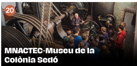
20 MNACTEC-Museu de la Colònia Sedó Carrer Continues, s/n 08292 Esparreguera ☎ 937 892 244 - ♿

La fortalesa inconquerible. La fortaleza inconquerible. The unconquerable fortress. La forteresse invincible.