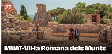
27 MNAT-Vila Romana dels Munts Passeig del Fortí, s/n 43893 Altafulla ☎ 977 652 806 - P

Un castell dins d'un parc natural. Un castillo dentro de un parque natural. A castle in a natural park. Un château dans un parc naturel.