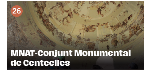
26 MNAT-Conjunt Monumental de Centelles Afores, s/n 43120 Constantí ☎ 977 523 374 - P ♿

Panteó reial de la Corona d'Aragó. Panteón real de la Corona de Aragón. Royal pantheon of the Kingdom of Aragón. Panthéon royal de la Couronne d'Aragon.