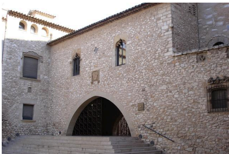
Seu de l'Arxiu Comarcal del Garraf