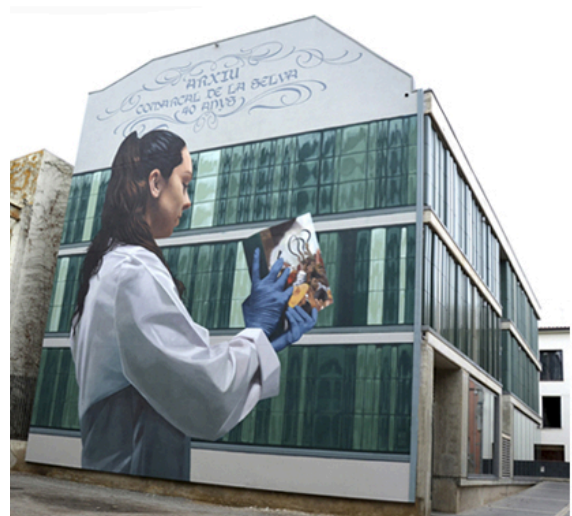
Seu de l'Arxiu Comarcal de la Selva