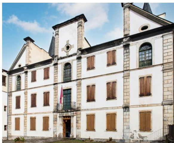
Era Casa deth Senyor, seu de l'Archiu Generau d'Aran