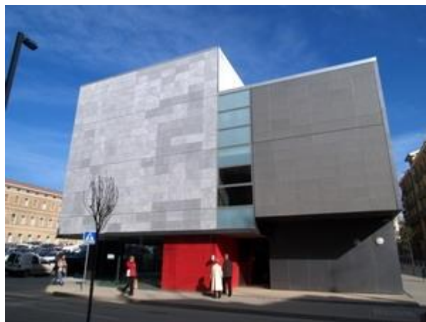
Seu de l'Arxiu Històric de Lleida