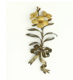
Englantina d'Or. Premi a la poesia "La sardana", guanyat als Jocs Florals de 1894

Joan Maragall i la seva família es van traslladar a la casa del carrer d'Alfons XII l'any 1899. La residència, que s'ha mantingut fins als nostres dies com un punt de reunió de la família, mostra avui un exemple d'una vivenda burgesa de la Barcelona de fa cent anys.