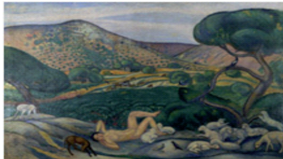
Pastoral , de Joaquim Sunyer (1911).

Una completa biblioteca crítica de diferents autors sobre l'obra de Maragall, les partitures originals i impreses de més de cent músics sobre poemes de l'autor, la col·lecció iconogràfica (dibuixos, gravats, fotografies, quadres, etc.) i uns 10.000 retalls de premsa completen el fons documental del centre.