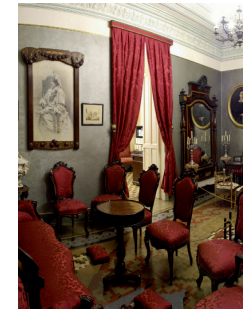
Saló noble, decorat amb retrats familiars