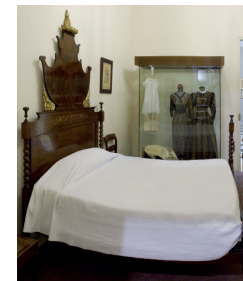
Dormitori d'estil isabelí, mitjan segle XIX