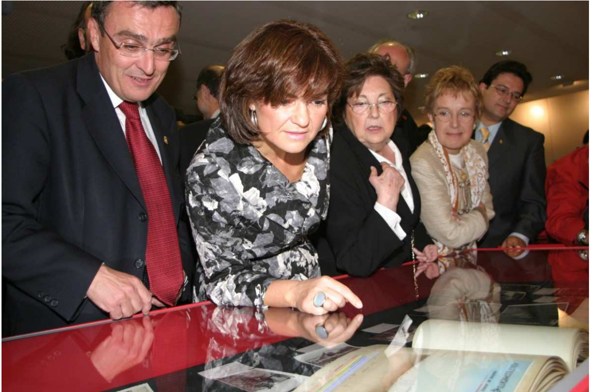
Carmen Calvo, ministra de Cultura, i altres d'autoritats contemplen l'exposició de documents el dia de la inauguració de l'Arxiu

Finalment, l'arxiu mostra el seu contingut organitzant exposicions i conferències, que són, en definitiva, activitats de difusió per a donar a conèixer la seva essència.