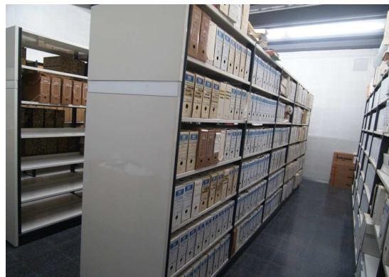
Sala de prearxivatge

Els arxivers transporten els documents amb els carros a la sala de tria on es fa una primera intervenció. Allí es netegen, es trien i comença el procés de classificació i ordenació. A resultes d'aquest procés és traslladen els documents classificats i ordenats als dipòsits de documentació i se separen, si és el cas, els documents infectats per insectes o fongs, els quals es deixen a la sala de desinsectació en espera de tractament.