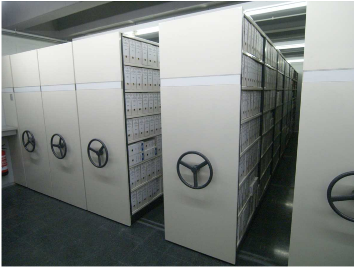
Dipòsit de documentació

Els documents, en funció del seu suport i les seves característiques físiques, es conserven en condicions i dipòsits diferents. En general, les millors condicions de conservació del paper són d'una temperatura constant de 19° i d'uns valors d'humitat al voltant del 50%. Els documents de gran format (pergamins, plànols, ...) es guarden al dipòsit de planeres . La documentació fotogràfica (fotografia en color, blanc i negre, negatius, microfilms, microfitxes, plaques de vidre, ...), pel·lícules i documentació en suport magnètic o digital es preserva als dipòsits frigorífics , sempre en funció de les seves característiques i les òptimes condicions de conservació en cada cas. Els tres dipòsits mantenen una temperatura constant de 4°, 12° i 19° respectivament, que garanteix la conservació en el temps.