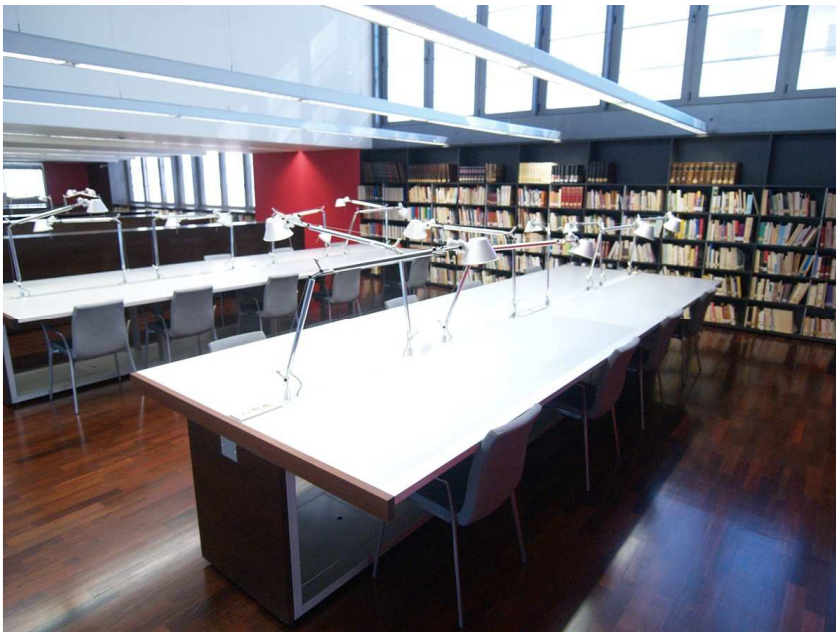
Sala de consulta

Passat tot aquest procés de condicionament, els documents estan preparats per ser consultats. La sala de consulta és l'espai on els ciutadans fan la seves consultes. L'arxiver orienta i facilita a l'usuari els instruments de descripció (inventaris i catàlegs). Els historiadors i estudiants consulten i interpreten els documents, i elaboren treballs sobre diferents aspectes de la història, les institucions, l'urbanisme, l'art, ... que són la base del coneixement de la nostra història com a poble. Com a suport a la investigació, l'usuari disposa d'una completa biblioteca auxiliar.