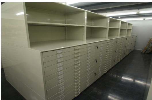
Dipòsit de planers

Els documents, en funció del seu suport i les seves característiques físiques, es conserven en condicions i dipòsits diferents. En general, les millors condicions de conservació del paper són d'una temperatura constant de 19° i d'uns valors d'humitat al voltant del 50%. Els documents de gran format (pergamins, plànols, ...) es guarden al dipòsit de planeres . La documentació fotogràfica (fotografia en color, blanc i negre, negatius, microfilms, microfitxes, plaques de vidre, ...), pel·lícules i documentació en suport magnètic o digital es preserva als dipòsits frigorífics , sempre en funció de les seves característiques i les òptimes condicions de conservació en cada cas. Els tres dipòsits mantenen una temperatura constant de 4°, 12° i 19° respectivament, que garanteix la conservació en el temps.