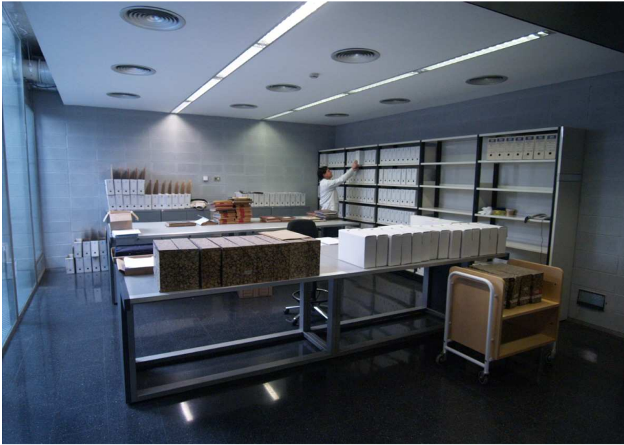
Sala de tria

Els documents ingressen als dipòsits d'arxiu i resten en espera fins que es faci la classificació i ordenació definitiva. És el moment on s'eliminen les còpies, es treuen les grapes i s'adeqüen els documents en les millors condicions de conservació per tornar als dipòsits. Tot aquest treball conclou amb l'elaboració dels inventaris i catàlegs de la documentació, instruments de control i d'informació que serviran a l'arxiver per a localitzar els documents demanats pels usuaris i investigadors o la mateixa administració que els ha generat.