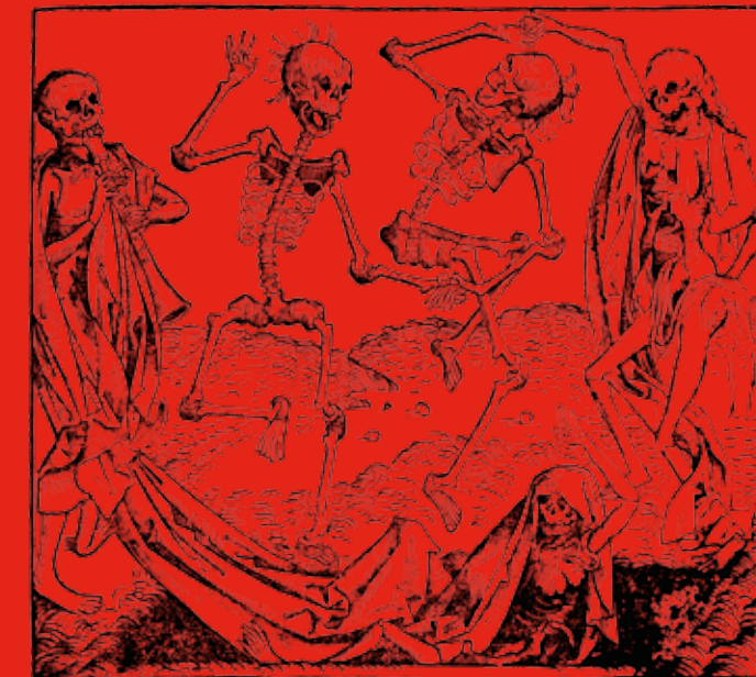
▼ Dansa macabra. Schedel Hartmann, Liber Chronicarum. Nuremberg. Anthonius Koberger, 1493