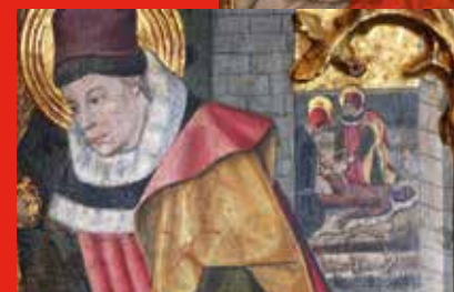
▲ A i B. Detall de la Pradel·la dels sants Cosme i Damià. Retaule dels sants Abdó i Sinén. Seu d'Egara. Església de Sant Pere de Terrassa. Segle XV. Museu de Terrassa. L'escena representa dues seqüències. En darrer terme, els sants metges practiquen l'amputació d'una cama a un pacient. En primer terme, es pot apreciar com els metges col·loquen una pròtesis de fusta al malalt.