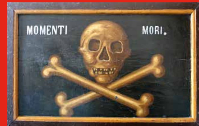
▲ Memento mori "Recorda que has de morir" Retauló. Pintura sobre taula, fusta Segle XVII Museu Etnogràfic de Ripoll