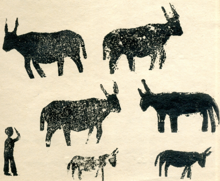
Dibuix i clixé de Rafel Puigercós (10 anys)