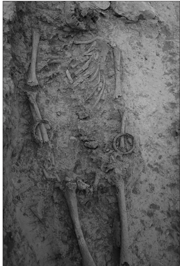
Figura 1. Enterrament ENT 66 amb braçalets. Detall del braçalet

Pel que fa a la seva funcionalitat, segons diferents estudiosos, les polseres i els amulets formen part