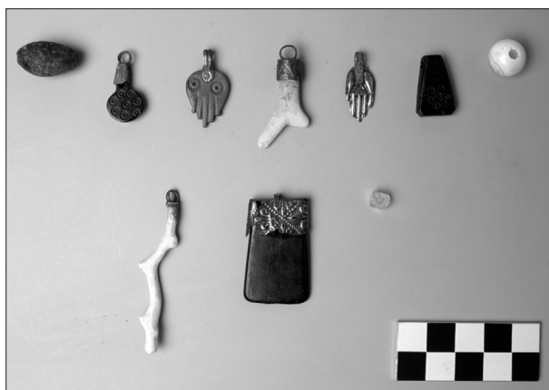
Figura 3. conjunt d'amulets de la UE 1185, dins la FS 163.

Aquest conjunt de penjolls està associat a un individu infantil (UE 1185), d'aproximadament 3 anys, inhumat en aquesta fossa. Els penjolls associats a aquest individu (UE 1185) són de diferents materials i formes. El collaret està format per dues hamses o mans de fàtima, una de plata i l'altra d'os; dos penjolls de corall, una placa d'atzabeja molt semblant a la del c/ la Font 7-9, aparegut en un context possiblement jueu (COLET et alii 2010); un penjoll rodó d'atzabeja, una dena de cristall de roca, una dena d'element orgànic encara per determinar, una altra placa d'atzabeja amb aplic de plata decorat amb flors de lis i una dena del que sembla mareperla. (fig 3) Trobem paral·lels de les hamses a la necròpolis he-