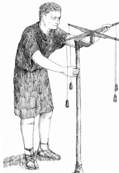
Extret del llibre d'en David Macaulay. Nacimiento de una ciudad romana