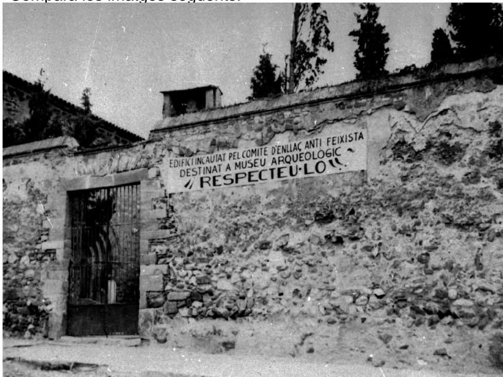
Esglésies de Sant Pere, 1936