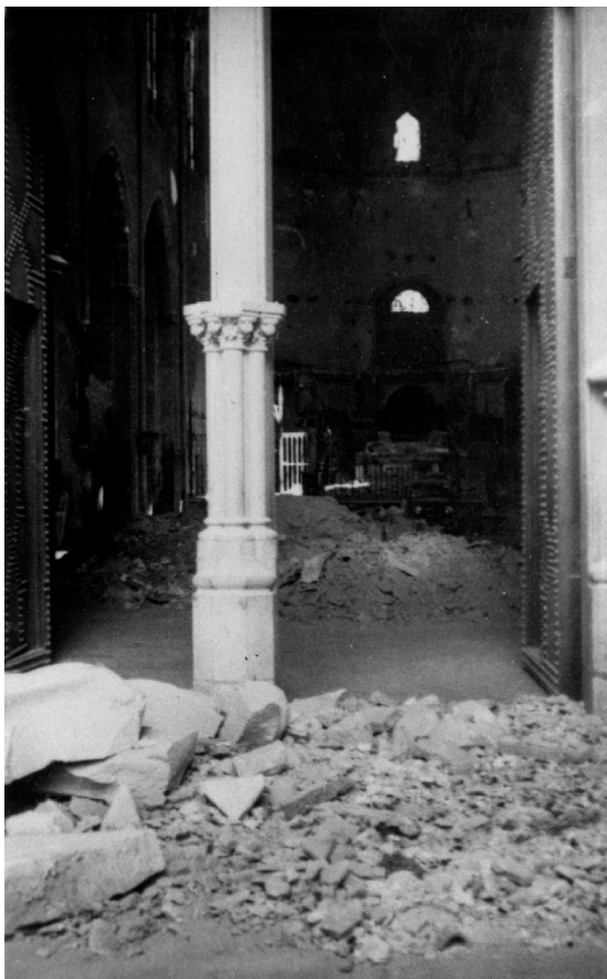
Església del Sant Esperit, 1936.