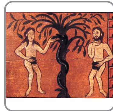
Adam i Eva

Fragment de taula lateral d'un altar Pintura sobre fusta Darrer quart del s. XII Procedència: Sant Andreu de Sagàs (Berguedà)