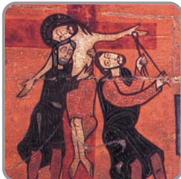
Davallament de la Creu

Fragment de taula lateral d'un altar Pintura sobre fusta Darrer quart del s. XII Procedència: Sant Andreu de Sagàs (Berguedà)