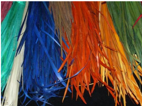
fer el cordell,