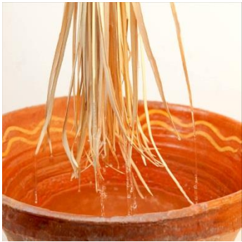
tintar els brins,