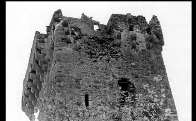
Restes de la instal·lació telegràfica ubicada al capdamunt de la torre de l'ermita de la Mare de Déu del Camí, encara visibles l'any 1972 Arxiu Municipal de Cambrils. Núm. reg. 5453-1-1

AGUILAR PÉREZ, Antonio. MARTÍNEZ LORENTE, Gaspar. «La telegrafia óptica en Cataluña. Estado de la cuestión». A Scripta Nova. Revista electrónica de Geografía y Ciencias Sociales . Universitat de Barcelona (15/03/2003)