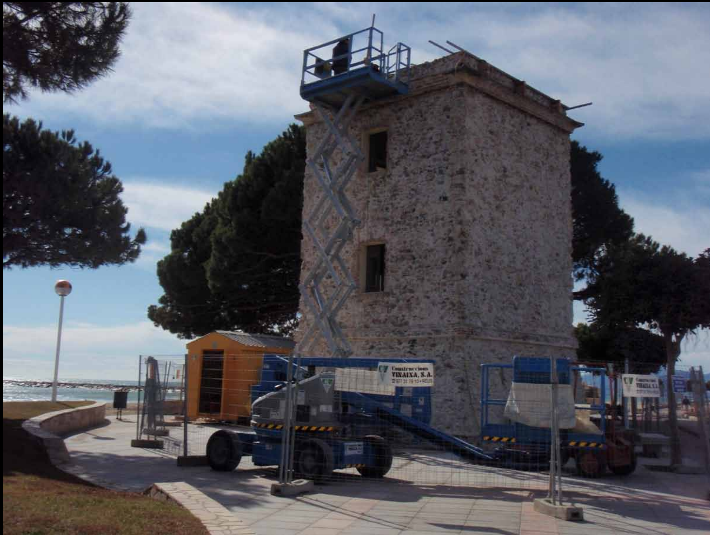
Obres de rehabilitació de la torre, l'any 2011