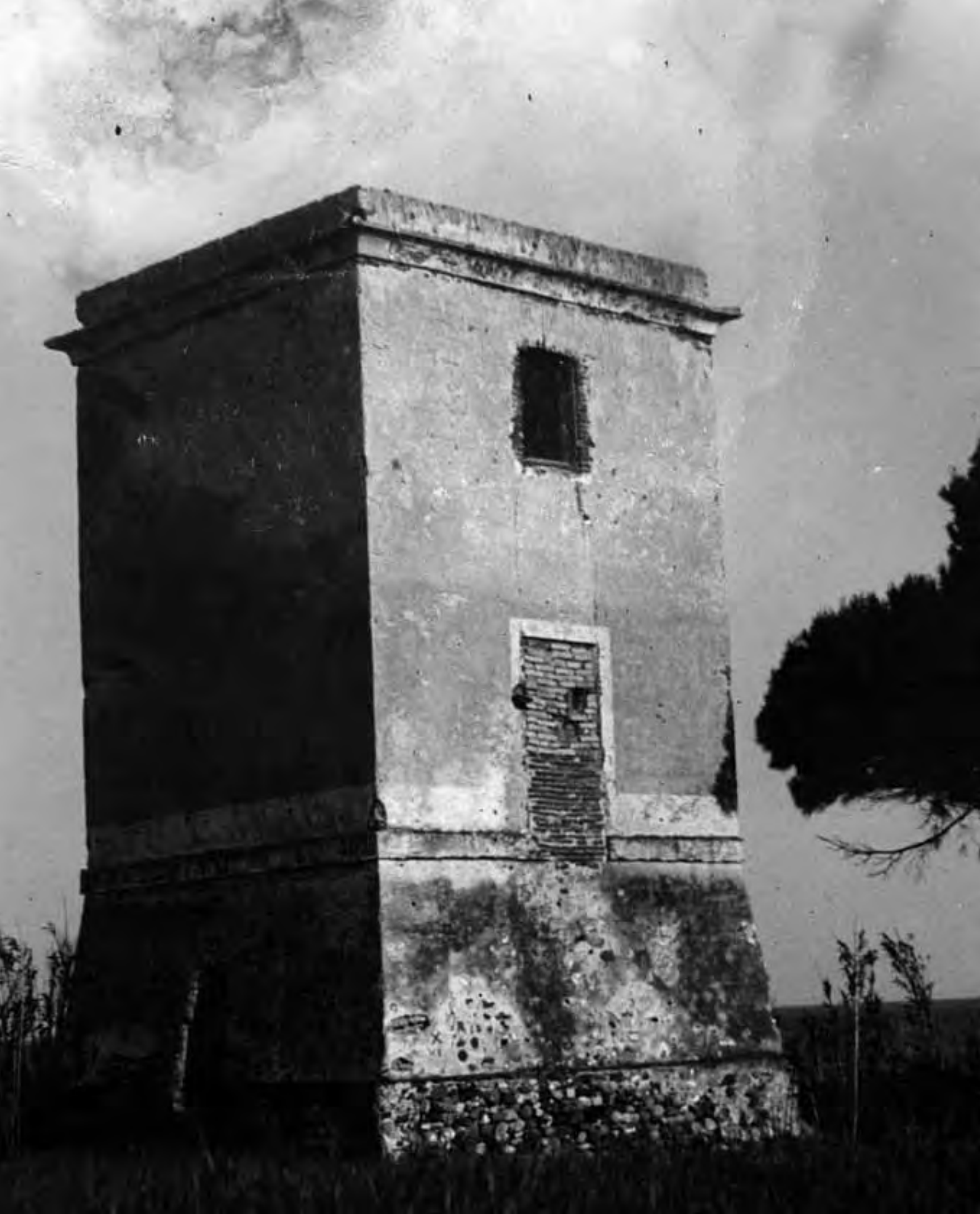
La torre de l'Esquirol cap al 1960, força malmesa i amb l'entrada original aparedada.

Arxiu Municipal de Cambrils. Fons Ortoneda Vernet. Núm. Reg. 9354-32-09