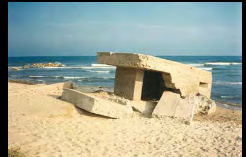
Niu de metralladores que fins a la dècada de 1990 va estar ubicat a la desembocadura de la riera de Riudoms

Malgrat tot, l'Esquirol va continuar essent un punt estratègic de comunicació. La prova és que el 1850 s'hi va construir la torre de telegrafia i, ja durant la guerra civil de 1936-1939, un niu de metralladores que vigilava un possible desembarcament de tropes franquistes que mai es va arribar a produir.