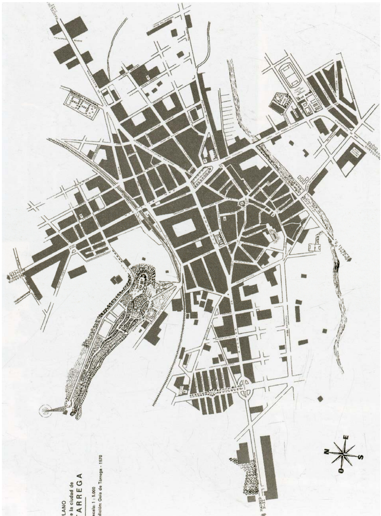
PLANO de la ciudad de TÀRREGA

Escala: 1 : 5.000 Edició: Guia de Tàrraga - 1970