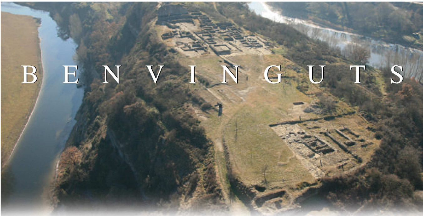
Vista aèria del jaciment de l'Esquerda.