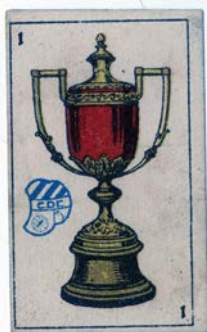
Cromos futbol diversos equips ACM70-268 UD105016