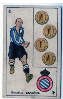
Cromos futbol diversos equips ACM70-268 UD105002