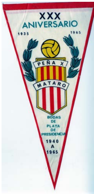
Banderola Peña X ACM70-04 UD275001