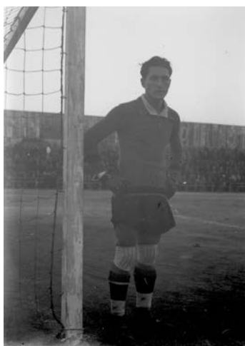
Fotografia futbol / Porter posant. ACM70, Fons Mañach -122. MAÑ 209