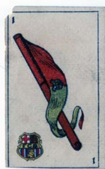
Cromos futbol diversos equips ACM70-268 UD105010