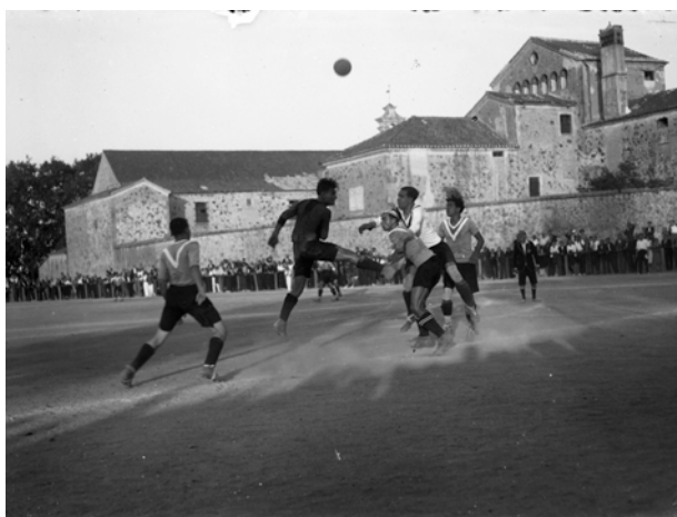
Fotografia de futbol / Diversos jugadors. ACM 70, Fons Mañach -122. MAÑ270