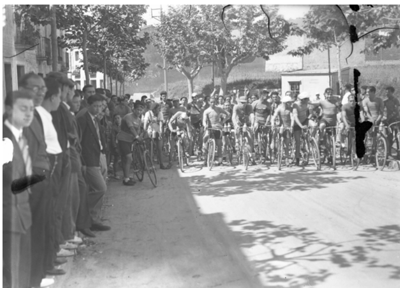
Fotografia ciclisme en blanc i negre.