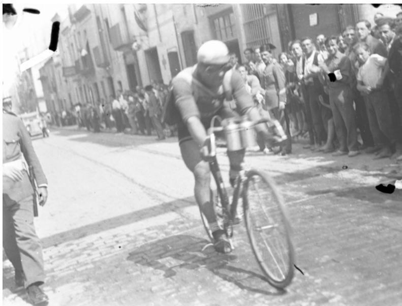
Fotografia ciclisme en blanc i negre. ACM 70- Col·lecció Joan Mañach / MAÑ 272

Aquí trobareu una petita mostra del material que podeu fer servir.