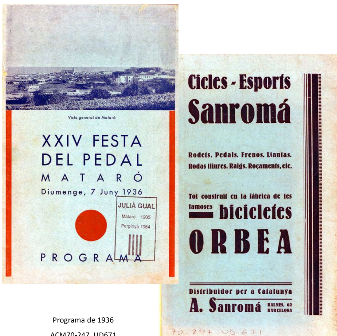
Programa de 1936 ACM70-247. UD671