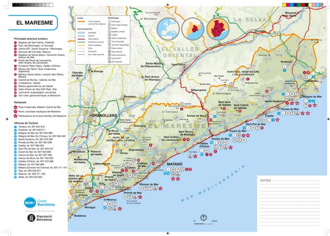
Mapa de 2004