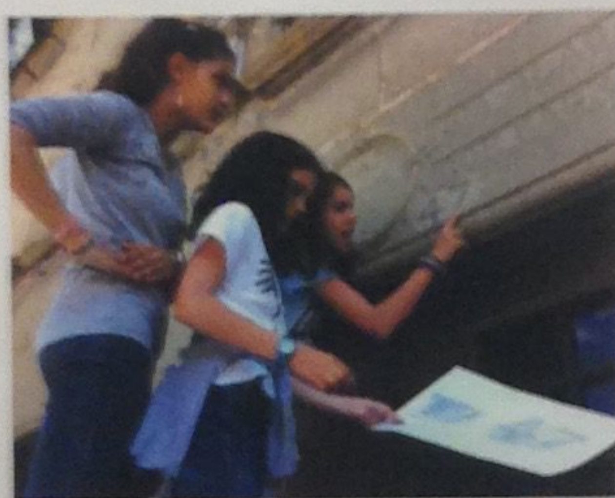
Ofici picapedrer-CEIP Mossèn Cinto de Folgueroles