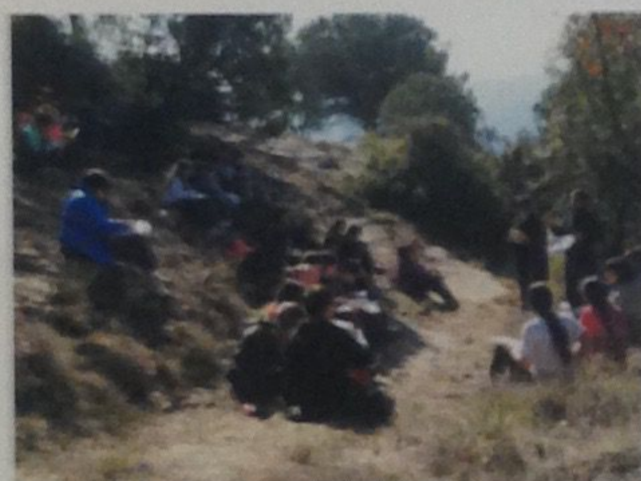
Via romana del Congost- Escola Joan XXII d'Hostalets de Balenyà