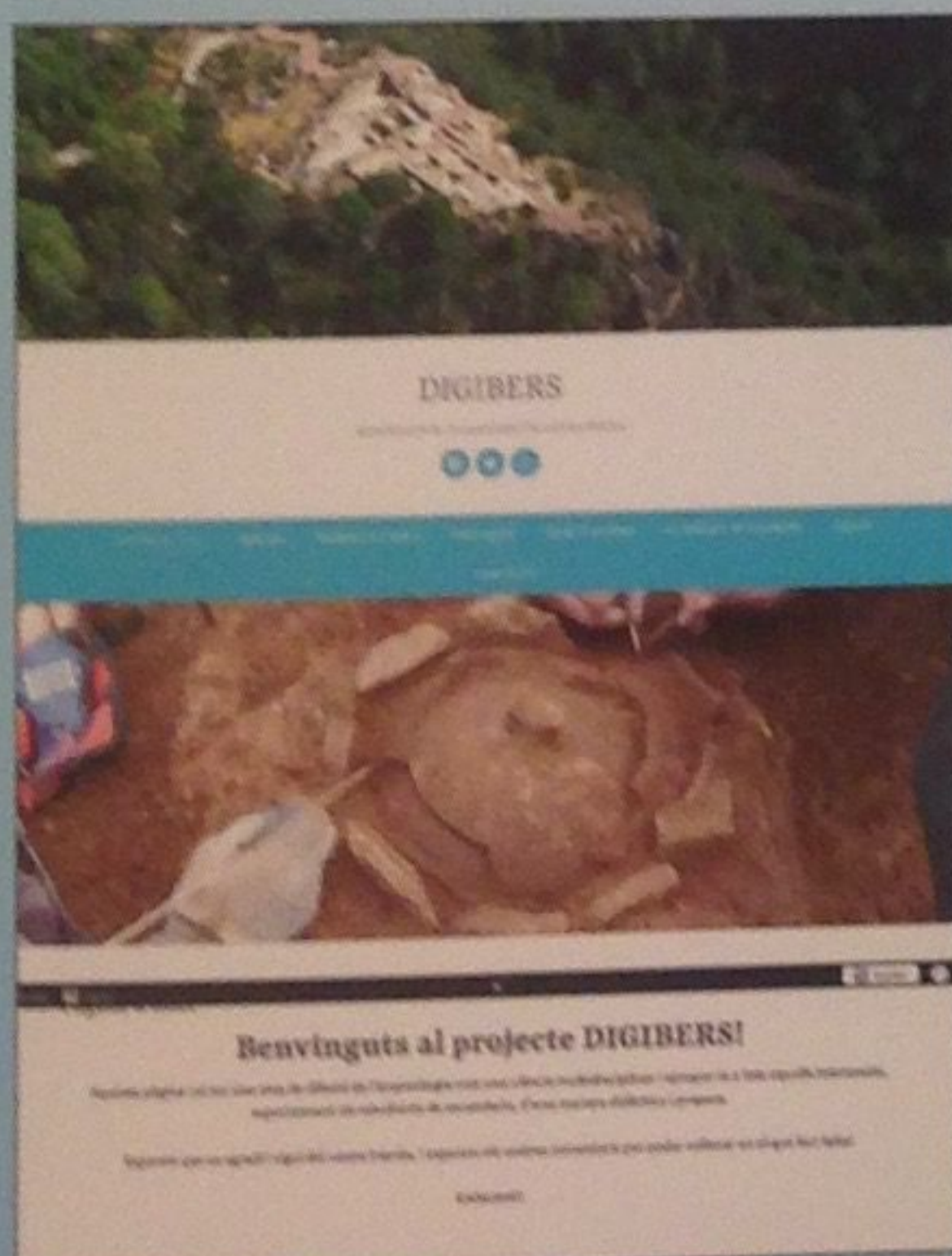
Pàgina web del projecte en creació.

Pel que fa a les entrevistes, en primer lloc es va contactar amb dos instituts de Tarragona, INS Berenguer d'Entença de l'Hospitalet de l'Infant i INS "Antoni de Martí i Franquès" de Tarragona. La col·laboració d'alguns professors d'aquests instituts ha sigut essencial a l'hora de preparar i orientar el projecte, sobretot per poder elaborar un "producte" adaptat i amb les característiques necessàries per al seu ús a l'aula.