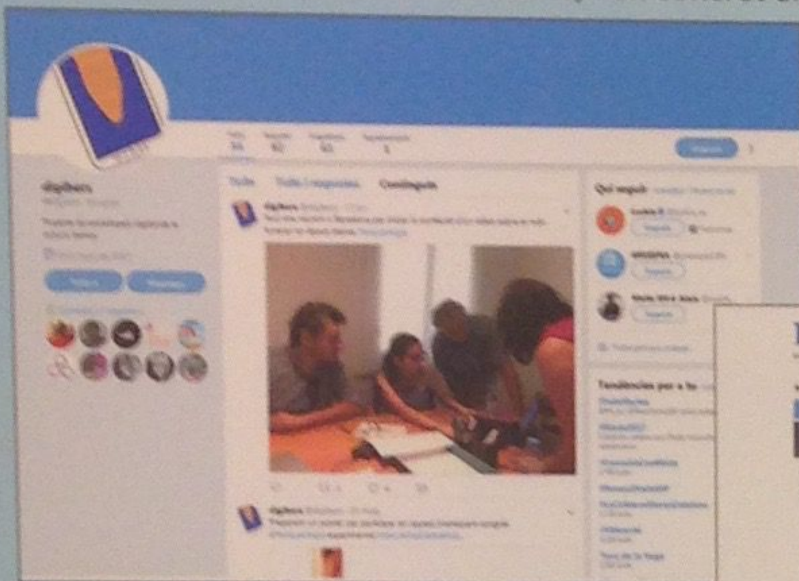
Twitter del projecte Digibers.

L'objectiu del projecte DIGIBERS és elaborar un pla pilot de socialització de la recerca que incorpori dos conceptes clau en divulgació i recerca, com són el de les humanitats digitals i el de recerca i innovació responsables (RRI). Amb aquest punt de partida es planteja l'elaboració d'un producte de divulgació en format digital que, per a la seva concepció i desenvolupament dels continguts, tingui en compte l'opinió i les necessitats del públic al qual preveu adreçar-se. Aquest públic és principalment l'educatiu, i en concret els alumnes de secundària.