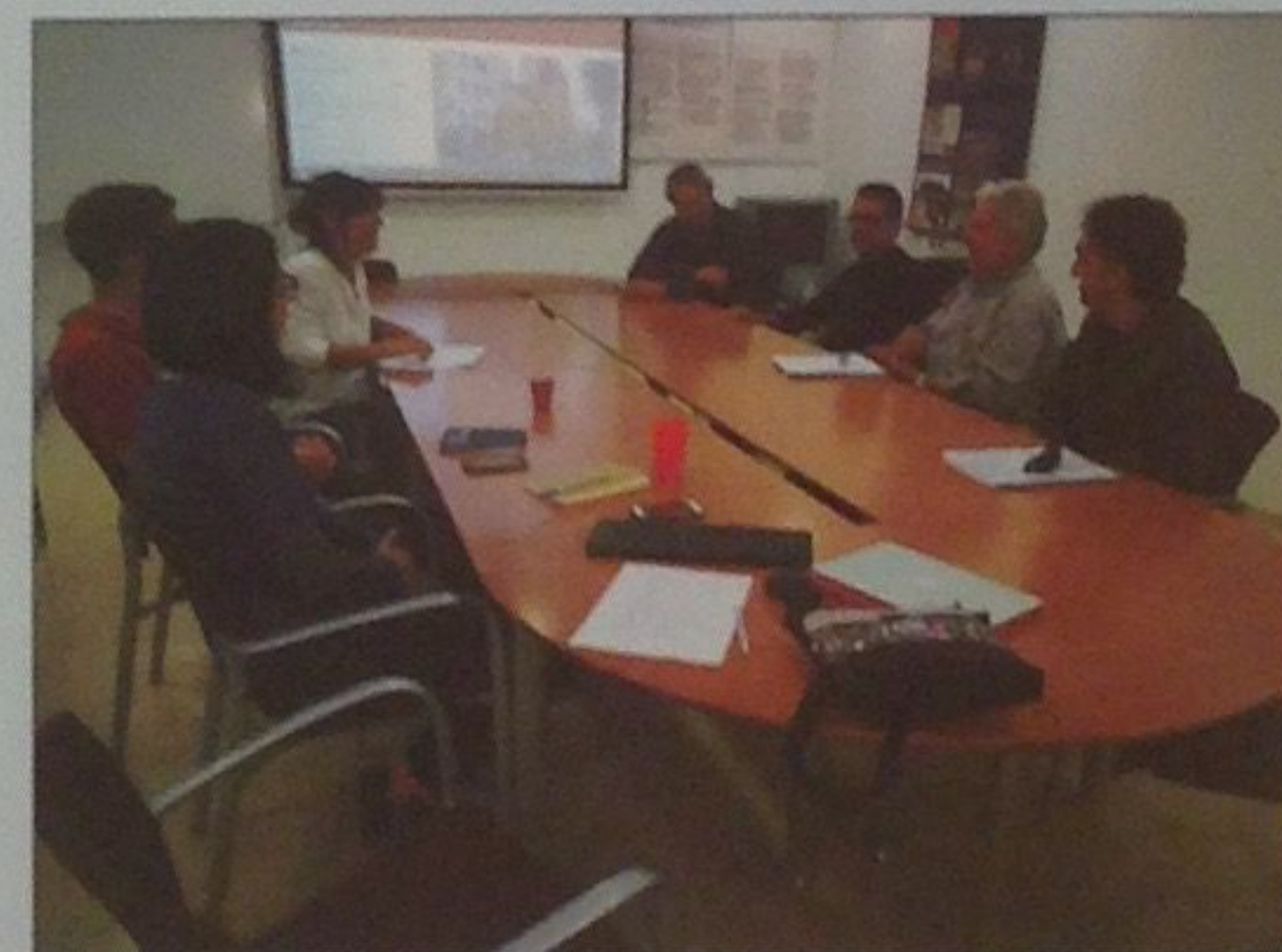
Reunió d'equip amb els professors dels instituts de Tarragona.

En base a la informació obtinguda d'aquestes entrevistes, hem elaborat un guió per realitzar un vídeo que permeti explicar la metodologia de la disciplina arqueològica, i que es pugui fragmentar en petits capítols.