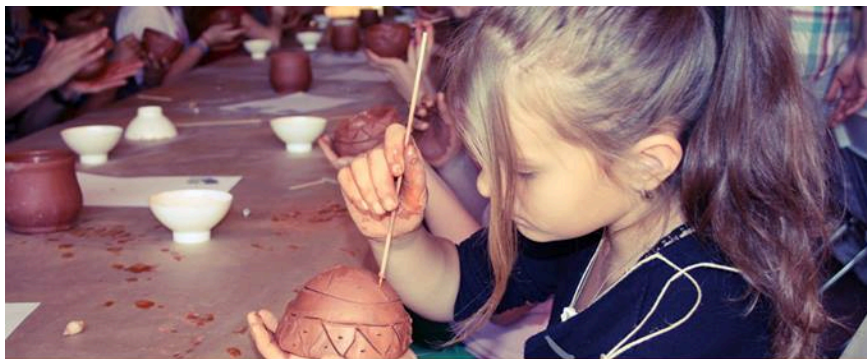
Taller pla de formació dels Serveis Educatius de La Noguera Curs 2016 - 2017

COM TREBALLAR AMB NENS I ADOLESCENTS LA DIDÀCTICA DE LES FONTS MATERIALS EN ARQUEOLOGIA I PREHISTÒRIA? L'EXEMPLE DELS MEGÀLITS DELS REGUERS DE SERÓ